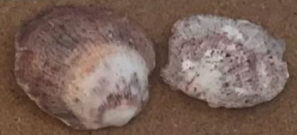
【チリボタン】 ウミギクカ