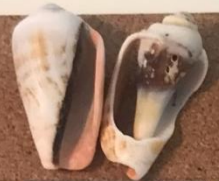
【マガキガイ】 ソデボラカ