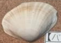
【バカガイ】 バオガイカ