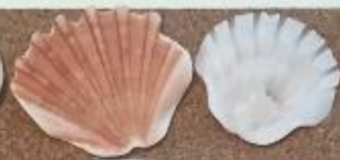
【イタヤガイ】 イタヤガイカ