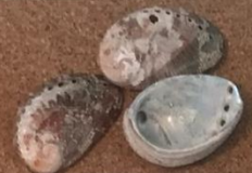
【トコブシ】 ミニガイカ