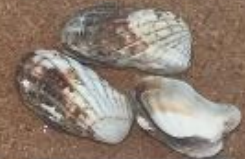
【トマヤガイ】 トマヤガイカ