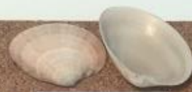
【マツアマツスシ】 マルスタシガイカ