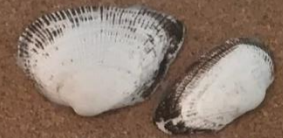
【エガイ】 ラネガイカ