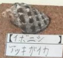
【イホニシ】 アツキガイカ